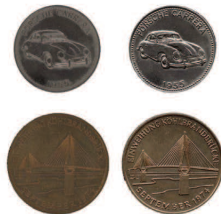
2D-скан по сравнению с 3D

WideTEK 25 является оптимальным выбором для решения любой задачи благодаря следующим особенностям: