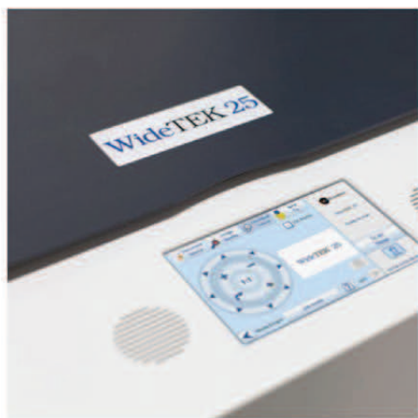
Большой сенсорный экран

Сканеру требуется менее трех секунд, чтобы сканировать документ размером 47x63,5 см в обычном режиме с разрешением 300 dpi и лишь 12 секунд в 3D-режиме с разрешением 600 dpi. Управляйте сканером из стандартного web-браузера, встроенного в сенсорный экран или посредством мобильного устройства на iOS либо Android с помощью нашего приложения Scan2Pad®.